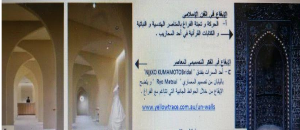
الشكل (2) يمثل الإيقاع في الفن الإسلامي والإيقاع في الفكر التصميمي المعاصر.

2- الإيقاع (Bhythm): يعد الإيقاع من أهم الصفات الكامنة في الفن الإسلامي والمحددة للسمات التصميمية له، ويؤكد الدكتور "عبد الباقي إبراهيم" أن الإيقاع هو مفردة تقع ضمن مفهوم أشمل أطلق عليه مصطلح "التنغيم" الذي تم اعتباره أحد قيم الفن الإسلامي التي تتضح عبر المستويات التشكيلية المختلفة، وينشأ الإيقاع من خلال حركة وتكرار واستمرارية العناصر الهندسية والنباتية والكتابية. ومن هنا تتبع الخصوصية الزخرفية في الفن الإسلامي والتي لا تتناقض مع خصوصية التأمل، كما يهتم الإيقاع في الفن الإسلامي بالكشف عن الجوانب الداخلية العميقة للحقيقة العليا، وعلى هذا الأساس فإن الإيقاع يشير إلى عدد من دلالات الشكل والمضمون في العمل التصميمي (عصفور، 2012، ص541).