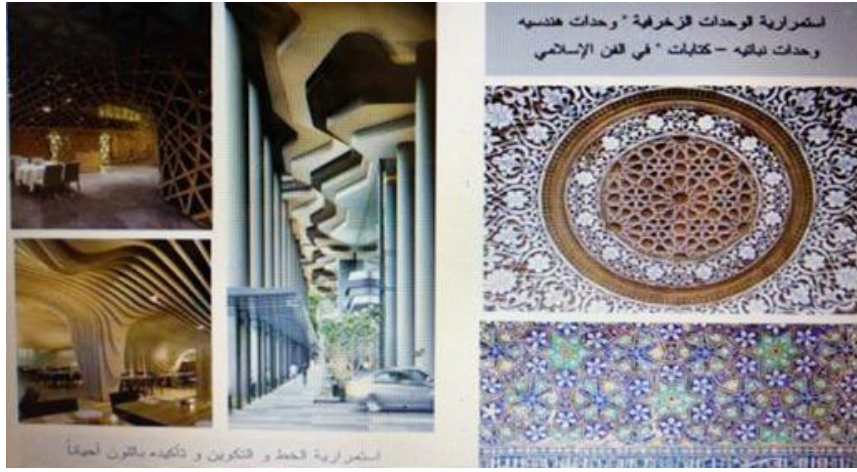
شكل (1): نماذج لتحقيق الوحدة في الفن الإسلامي

(ب) وحدة التوجيه: تنشأ وحدة التوجيه من انطلاق الفراغ من نقطة مركزية وحولها يتكوّن الشكل، شكل (1، أ، ج).